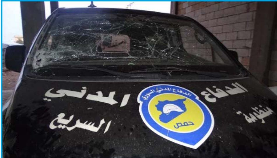
الأضرار الناجمة عن قصف طيران ثابت الجناح تابع لقوات النظام السوري سيارة إسعاف تابعة للدفاع المدني في مدينة الرستن/ حمص / 24 / 3 / 2017

الجمعة 24/ آذار/ 2017 قصف طيران ثابت الجناح تابع لقوات النظام السوري صاروخين قرب سيارة إسعاف تابعة للدفاع المدني في مدينة الرستن بريف محافظة حمص الشمالي؛ ما أدى إلى إصابة محرك السيارة بأضرار مادية متوسطة وتشمم زجاج النافذة الأمامية، تخضع المدينة لسيطرة فصائل المعارضة المسلحة.