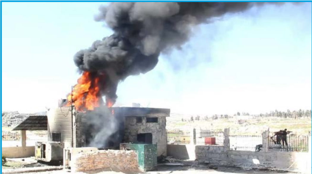
احترق غرفة خزان الوقود والمولدة جراء قصف طيران ثابت الجناح نعتقد أنه روسي

ظهر السبت 25/ آذار/ 2017 شن طيران ثابت الجناح نعتقد أنه روسي 3 غارات متتالية بالصواريخ قرب مشفى كفر نبل الجراحي (مشفى الأورينت سابقاً) الواقع شمال مدينة كفر نبل بريف محافظة إدلب الجنوبي؛ ما أدى إلى إصابة خزان الوقود والمولدة الخاصين بالمشفى بأضرار مادية متوسطة ، ونتيجة القصف المكثف أعلن المشفى خروجه عن الخدمة، تخضع المدينة لسيطرة مشتركة بين فصائل المعارضة المسلحة وتنظيم جبهة فتح الشام.