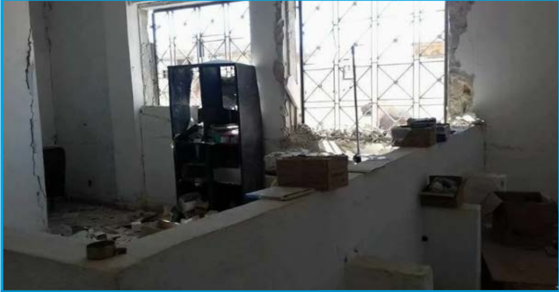
الأضرار الناجمة عن قصف راجمات صواريخ قوات النظام السوري النقطة الطبية في بلدة كفر نبودة/ حماة في 28 /3 /2017

الثلاثاء 28 / آذار / 2017 قصف طيران ثابت الجناح تابع لقوات النظام السوري صواريخ عدة قرب مبنى المستوصف -ملاصق لفرن الخبز الآلي- في مدينة حلفايا بريف محافظة حماة الشمالي الغربي؛ ما أدى إلى إصابة المبنى ومواد إكسائه بأضرار مادية متوسطة، تخضع المدينة لسيطرة فصائل المعارضة المسلحة.