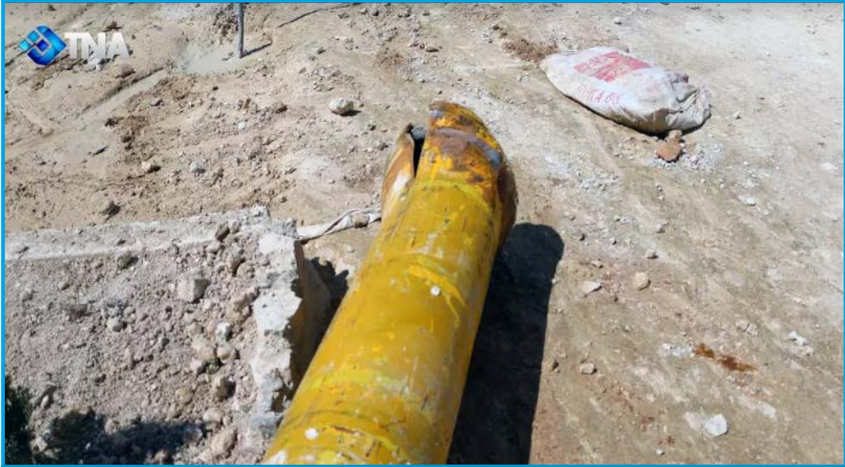
صورة تُظهر مخلفات برميل متفجر يحوي اسطوانات محملة بغاز سام ألقاه الطيران المروحي التابع لقوات النظام السوري على بلدة اللطامنة بريف محافظة حماة الشمالي الغربي، السبت 25 آذار/ 2017