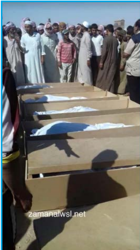
جثامين بعض ضحايا مجزرة ارتكبتها ميليشيات موالية لقوات النظام السوري في مزرعة الهوات/ ريف حماة/ في 4 / 9 / 2017