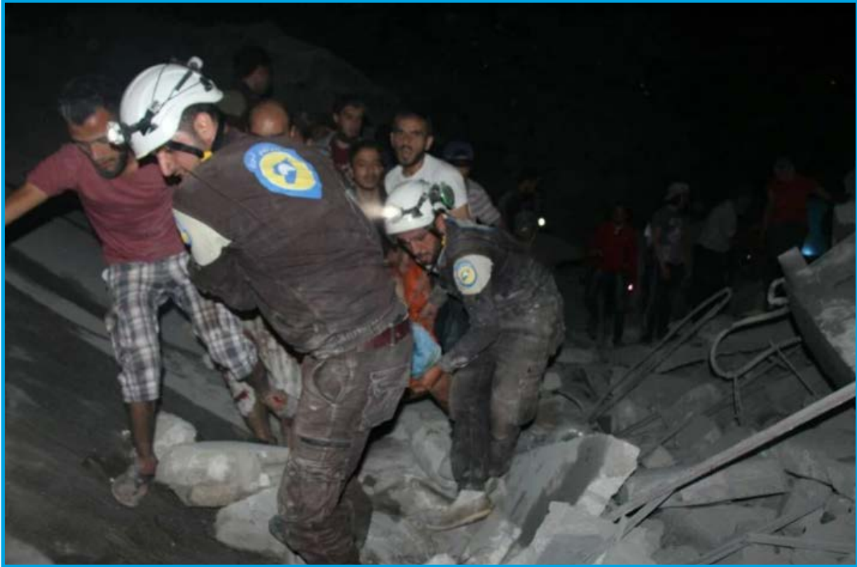
انتشال بعض ضحايا مجزرة ارتكبتها قوات النظام السوري في بلدة أرمناز/ ريف إدلب/ في 29 / 9 / 2017

الجمعة 29/ أيلول/ 2017 قصف طيران ثابت الجناح (Su-24) تابع لقوات النظام السوري 12 صاروخاً على حي سكني جنوب شرق بلدة أرمناز بريف محافظة إدلب الغربي؛ ما أدى إلى مقتل 39 شخصاً ، بينهم 9 أطفال ، و 11 سيدة ، إضافة إلى دمار كبير في نحو 15 منزلاً ، تخضع بلدة أرمناز لسيطرة فصائل في المعارضة المسلحة وقت الحادثة.