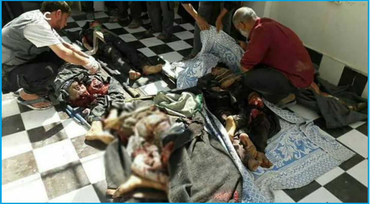
جثامين بعض ضحايا مجزرة ارتكبتها قوات النظام السوري في بلدة بيت سوي/ ريف دمشق/ في 29 / 9 / 2017