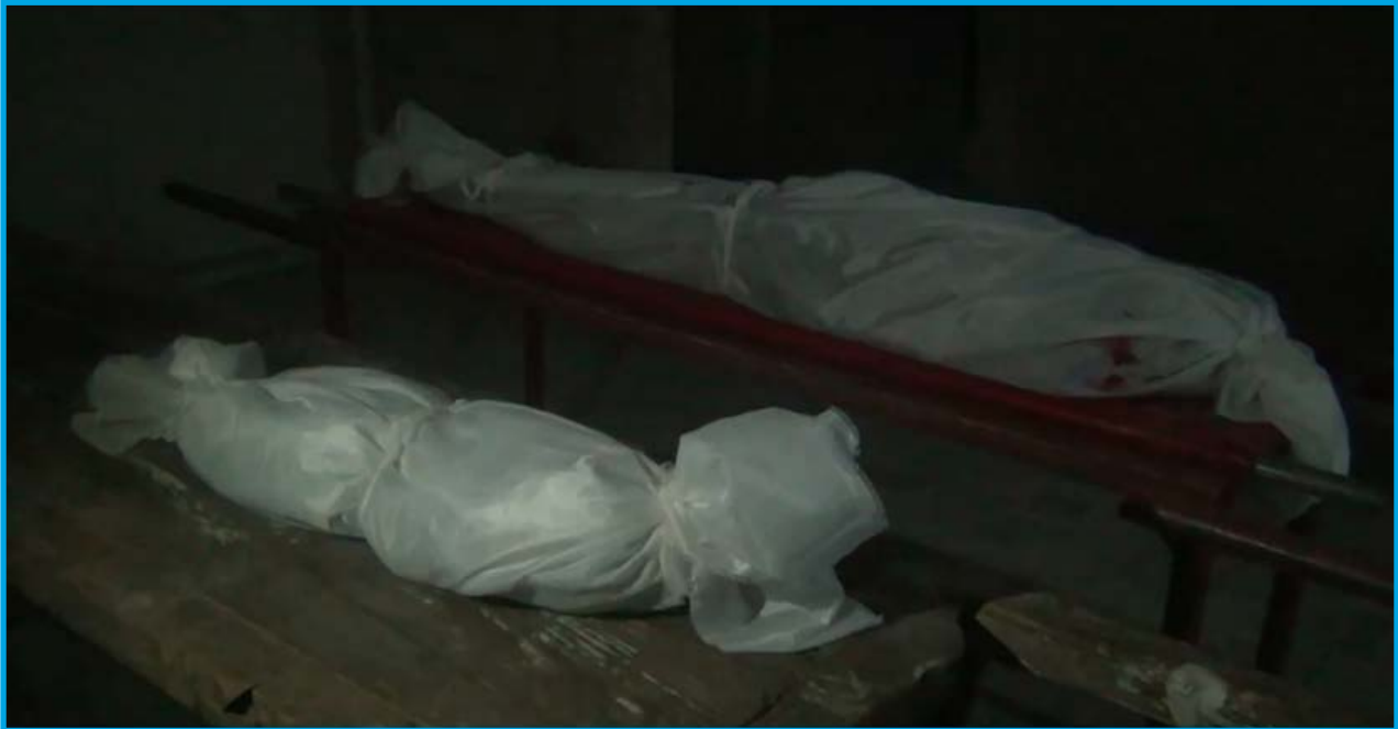
جثامين بعض ضحايا مجزرة ارتكبتها الميليشيات الشيعية الموالية لقوات النظام السوري في مدينة تلييسة/ ريف حمص/ في 29/ 9/ 2017

الجمعة 29/ أيلول/ 2017 قصفت الميليشيات الشيعية الموالية للنظام السوري المتمركزة في قرية الأشرفية ذات الأغلبية الشيعية في ريف حمص الشمالي صاروخ أرض - أرض على منزل في مدينة تلييسة بريف محافظة حمص الشمالي ؛ ما أدى إلى مقتل 7 أشخاص دفعة واحدة، بينهم رضيعة وسيدة ، وإصابة 5 آخرين بجراح. تخضع المدينة لسيطرة فصائل في المعارضة المسلحة وقت الحادثة.