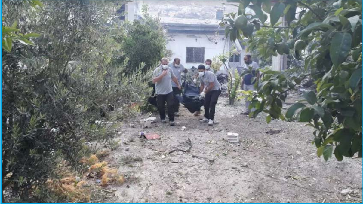
جثمان أحد ضحايا مجزرة ارتكبتها قوات الحلف السوري - الروسي في بلدة قلعة المضيق/ ريف حماة/ في 20 / 9 / 2017

الأربعاء 20/ أيلول/ 2017 قرابة الساعة 16:15 قصف طيران الحلف السوري - الروسي ثابت الجناح بالصواريخ السوق الرئيس وسط بلدة قلعة المضيق بريف محافظة حماة الشمالي الغربي؛ ما أدى إلى مقتل 11 شخصاً، بينهم 4 أطفال، و3 سيدات، تخضع بلدة قلعة المضيق لسيطرة فصائل في المعارضة المسلحة وقت الحادثة.