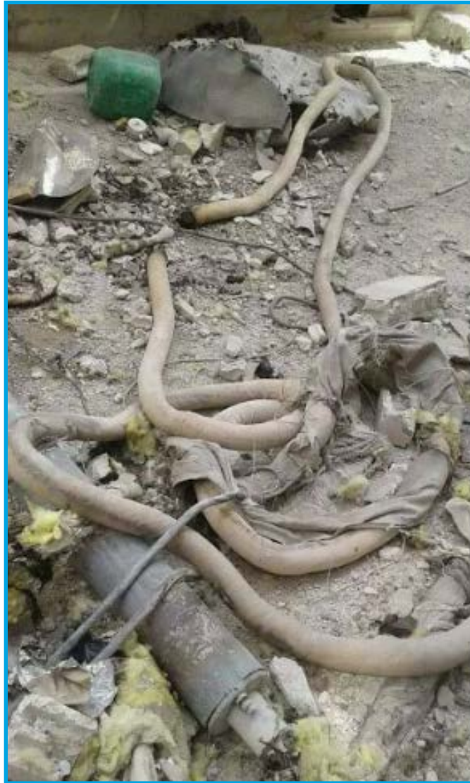
خرطوم غير مُنفجر عثر عليه في حي القابون بدمشق نيسان/ 2017

تُظهر الصور التي حصلنا عليها أو وصلتنا من نشطاء محليين، وأخرى منشورة عبر الإنترنت، مواقع سقوط هذه الخراطيم، والدمار الكبير الذي ألحقته، وبكل تأكيد فإن استمرار حصار وقصف هذه الأحياء ضاعف من صعوبة توثيق عدد آخر من الهجمات، وجعل هناك تفاوتاً في الأدلة بين حادثة، وأخرى، وتحتفظ الشبكة السورية لحقوق الإنسان بنسخ إضافية من جميع الصور والفيديوهات ضمن قاعدة بيانات سرية، وتتم أرشفتها بشكل دوري.