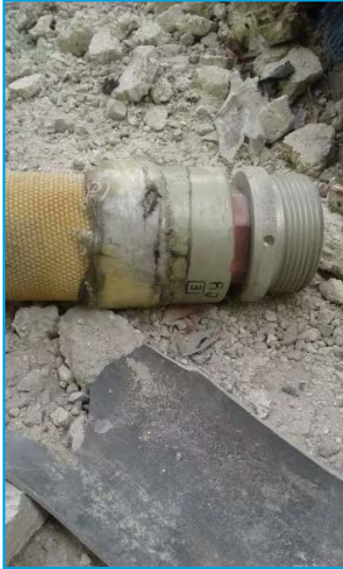
بقايا خرطوم مُتفجر استخدمته قوات النظام السوري في حي القابون نيسان/ 2017

مقطع مصور بثته صحيفة تشرين الموالية للنظام السوري يُظهر كاسحة الألغام الروسية التي تستهدف حيي القابون وتشرين في 23/ نيسان/ 2017