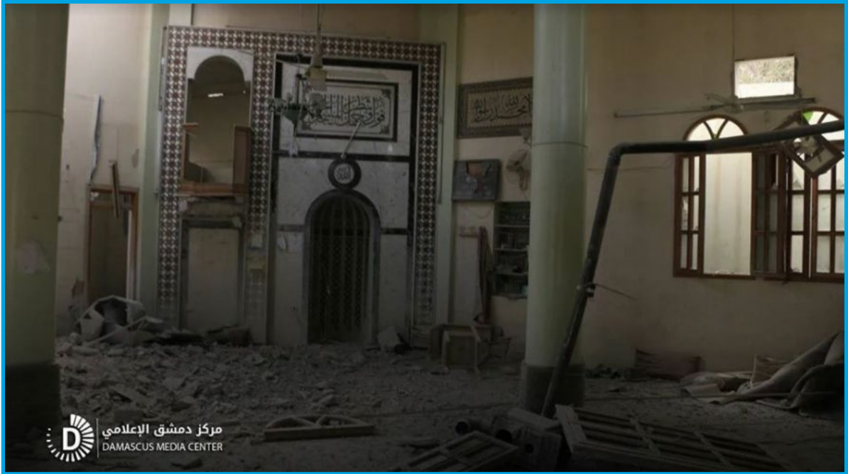
أضرار في مسجد النور في مدينة سقبا إثر قصف لقوات النظام السوري 2018/2/8

الخميس 8 / شباط / 2018 قصف طيران ثابت الجناح تابع لقوات النظام السوري صاروخاً على مسجد النور شرق مدينة سقبا؛ ما أدى إلى دمار جزئي في بناء المسجد وإصابة أثاثه بأضرار مادية كبيرة وخروجه عن الخدمة.