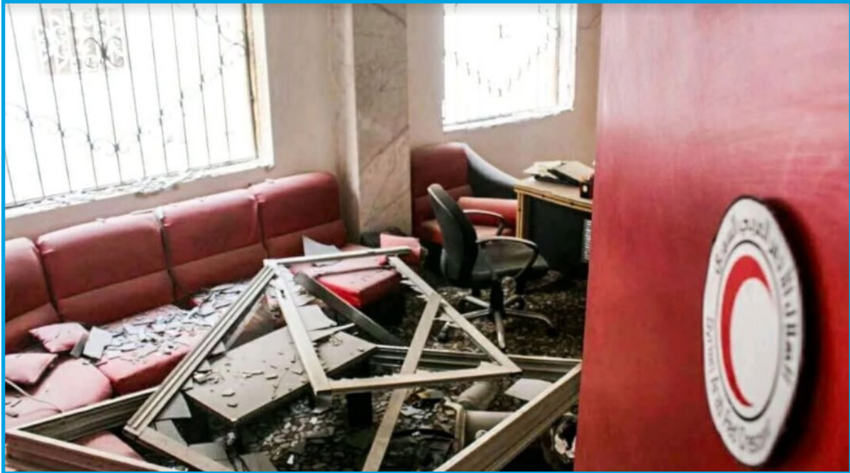
أضرار في إحدى غرف مركز الهلال الأحمر السوري في مدينة عربين جراء قصف طيران النظام السوري 8 / 2 / 2018

الخميس 8 / شباط / 2018 قرابة الساعة 14:30 قصف طيران ثابت الجناح تابع لقوات النظام السوري بالصواريخ مركز الهلال الأحمر السوري في مدينة عربين؛ ما أدى إلى دمار جزئي في بناء المركز وإصابة تجهيزاته بأضرار مادية كبيرة وخروجه عن الخدمة، نُشير إلى أن منظمة الهلال الأحمر السوري تتخذ من بناء شعبة التجنيد سابقاً في عربين مقراً لها. تواصلنا مع أحد العاملين في المركز 5 الذي فضّل عدم ذكر اسمه، وأخبرنا أنّهم كانوا مكلفون بتوزيع وجبات متمّمات غذائية لأطفال سوء التغذية، وتوزيع حليب أطفال دوري حسب القوائم: "كان التوزيع مقررًا بين الساعة الواحدة ظهراً والثالثة عصراً، وأثناء وجود المراجعين بدأنا نسمع أصوات القصف على أماكن بعيدة نسبياً عن المركز، لكنّ عملنا استمرّ؛ حاجة الأطفال للغذاء، ولاعتيادنا على القصف المستمر، إلا أنّ المركز أُصيب بشكل مباشر بصاروخ قرابة الساعة الثانية والنصف، وفي ذلك الوقت كان هناك ثلاثة مراجعين وخمسة من عناصرنا، أُصيب معظمهم برضوض" أضاف أنّ القصف لم يهدأ وعاود الطيران الحربي استهدافه للمركز ومحيطه بأربع غارات في غضون ساعة واحدة: "يحوي المركز على مركز لقاح ومركز متابعة سوء التغذية، وإدارة الكوارث، وتمثّلت الأضرار بدمار جزئي في البناء والمعدات، وخروج نقطة الهلال عن الخدمة حالياً".