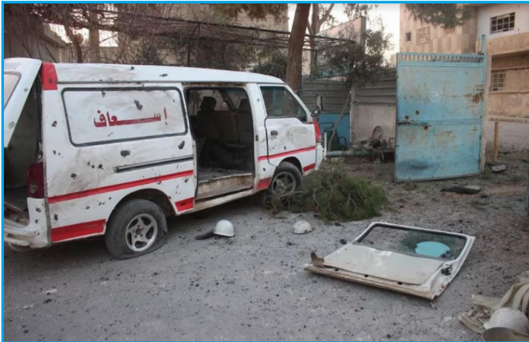
أضرار في سيارة إسعاف تابعة للدفاع المدني إثر قصف مدفعية النظام السوري بلدة النشائية 6/ 2/ 2018

الثلاثاء 6/ شباط/ 2018 قصفت مدفعية تابعة لقوات النظام السوري قذيفة قرب سيارة إسعاف تابعة للمركز 114 التابع للدفاع المدني في بلدة النشائية في منطقة المرج؛ ما أدى إلى إصابة السيارة بأضرار مادية كبيرة وخروجها عن الخدمة.