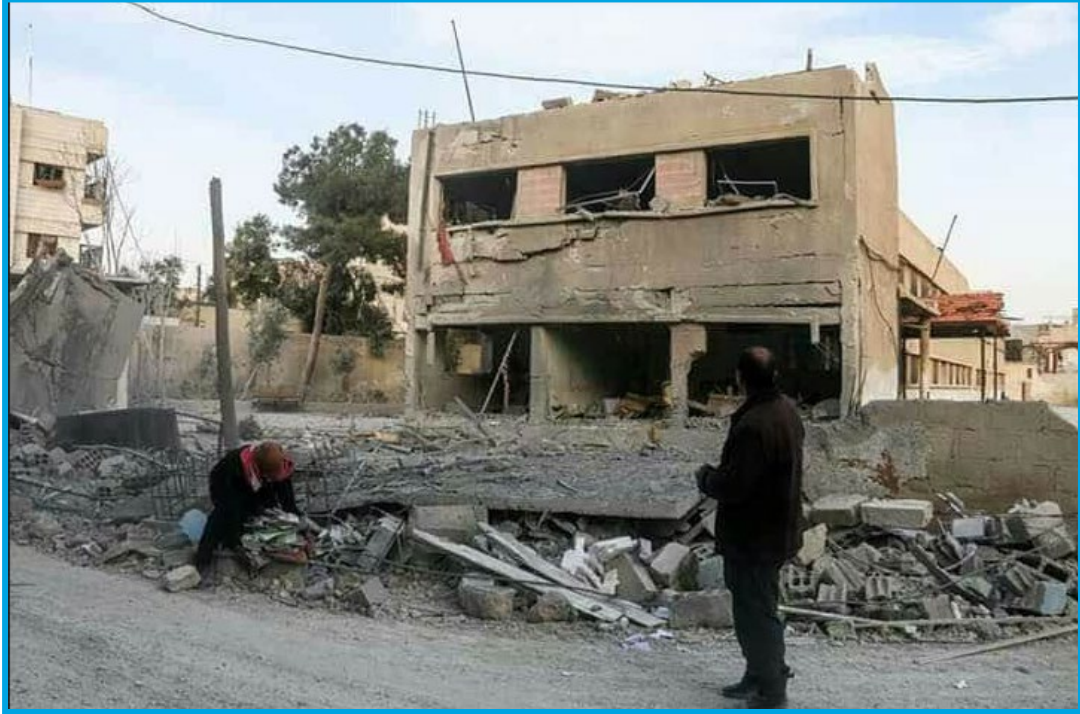
دمار في مبنى جامعة حلب "الحرّة" إثر قصف طيران النظام السوري مدينة عربين 9 / 2 / 2018