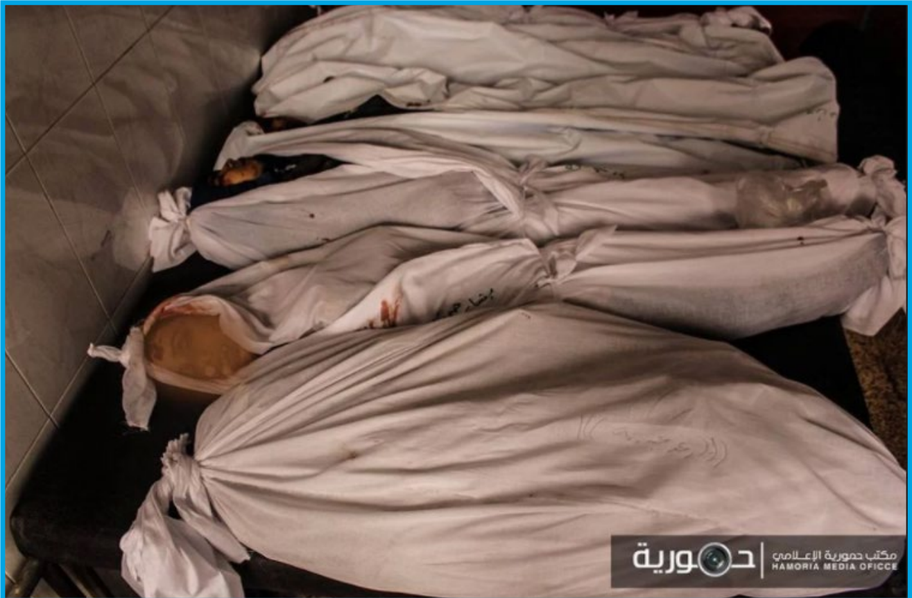
ضحايا مجزة إثر هجوم جوي للنظام السوري على بلدة حمورية 7 / 2 / 2018

الأربعاء 7 / شباط / 2018 قصف طيران ثابت الجناح تابع لقوات النظام السوري بالصواريخ بلدة حمورية؛ ما أدى إلى مقتل 11 مدنياً ، بينهم 6 طفلاً ، و 1 سيدة .