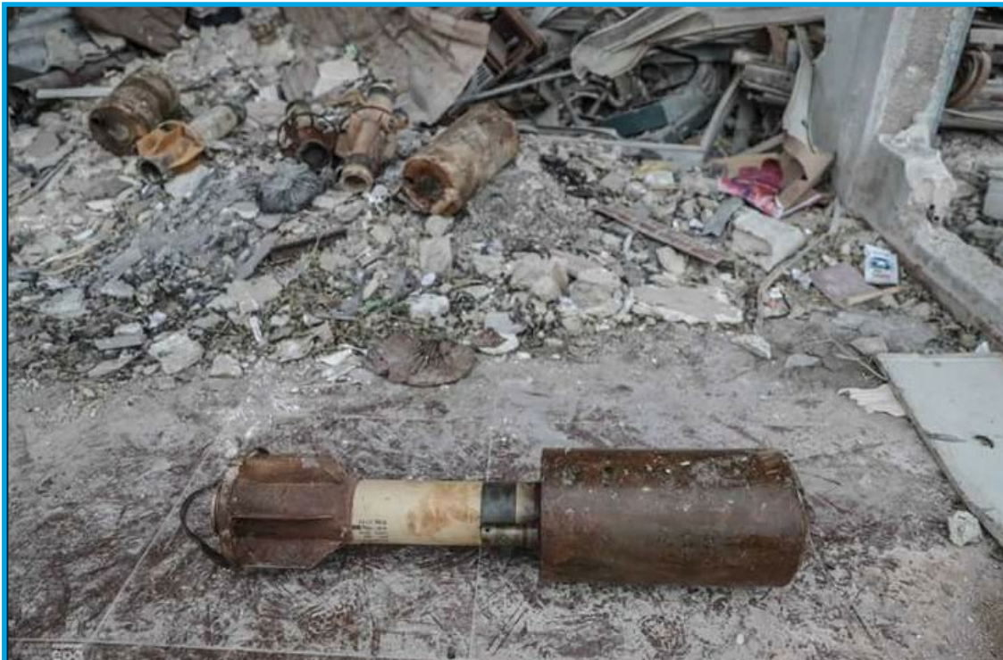
مخلفات صواريخ يُزعم أنّها محملة بمواد سامة عُثِرَ عليها بعد هجوم أرضي نفّذته قوات النظام السوري على مدينة دوما 22/ كانون الثاني/ 2018