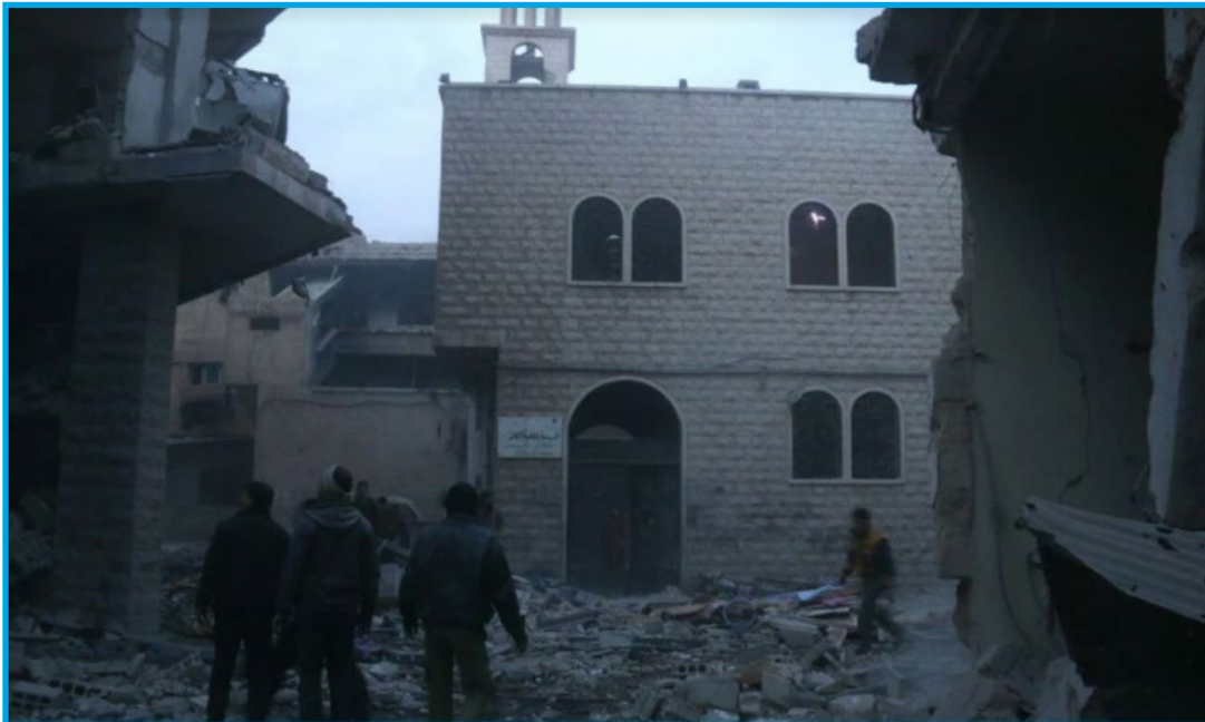
Image shows the damages in Saint, Gorgeous Orthodox Church in Irbeen city in Eastern Ghouta east of Damascus suburbs governorate due to missiles fired by Syrian regime warplanes, on February 8, 2018

الخميس 8 / شباط / 2018 قصف طيران ثابت الجناح تابع لقوات النظام السوري صواريخ عدة قرب كنيسة القديس جاورجيوس للروم الأرثوذكس في مدينة عربين؛ ما أدى إلى دمار جزئي في بناء الكنيسة، وإصابة أثاثها بأضرار مادية كبيرة.