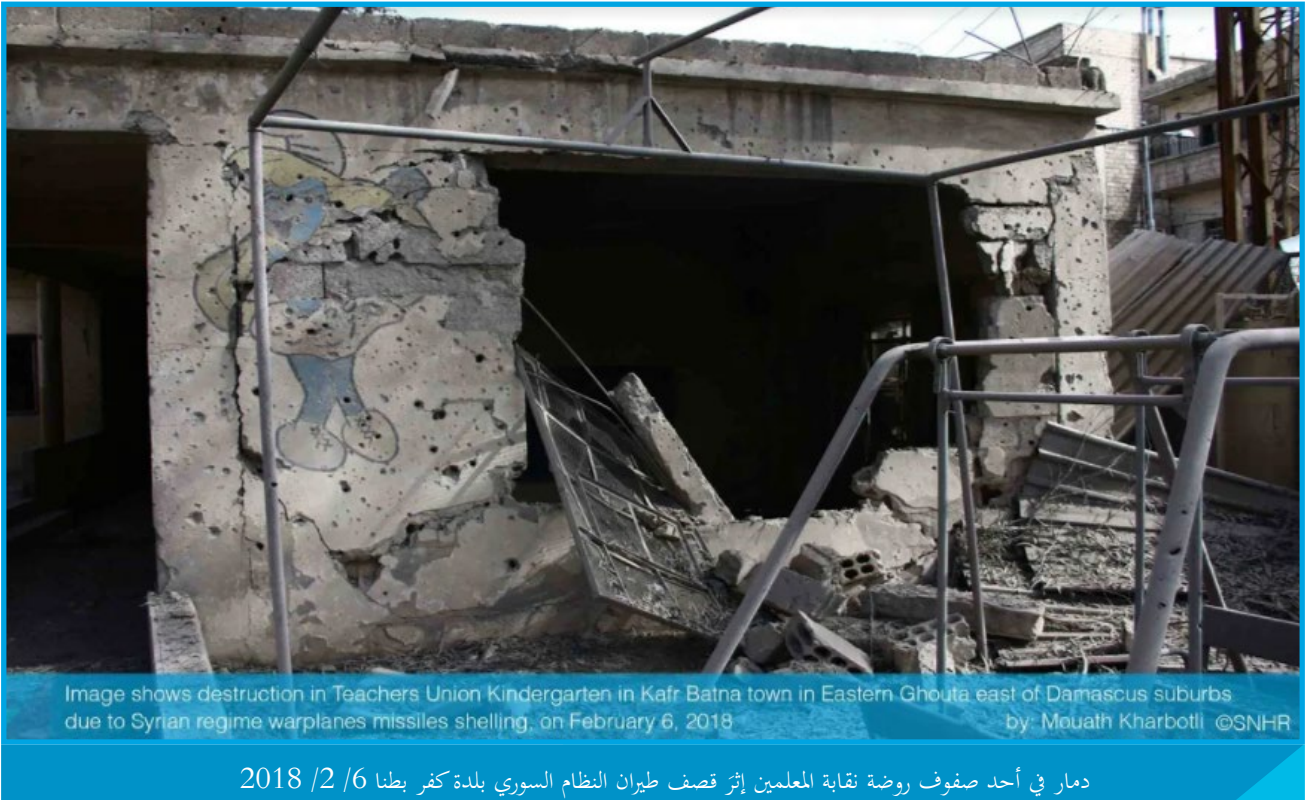
دمار في أحد صفوف روضة نقابة المعلمين إثر قصف طيران النظام السوري بلدة كفر بطنا 6/ 2/ 2018