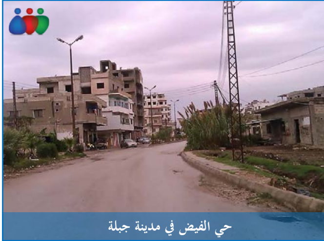
حي الفيض في مدينة جبلة

في يوم الجمعة ١٢/ كانون الأول، طوق نحو ٢٠٠ عنصر من القوات الحكومية حي الفيض، الواقع داخل مدينة جبلة بشكل تام، من جهة البحر غرباً حتى جامع الفيض شرقاً، ومن جهة القميرة جنوباً حتى البازار شمالاً، ومُنِع الدخول والخروج من وإلى الحي، وبدأ العناصر باقتحام المنازل، واعتقال شباب الحي، ثم سوقهم في حافلات عسكرية، استمرت الحملة ست ساعات تقريباً. أفاد عدد من الأهالي الذين فقدوا أبناءهم - الشبكة السورية لحقوق الإنسان- بأن الهدف من الاعتقال هو إجبار آبائهم على الانضمام إلى القوات الحكومية.