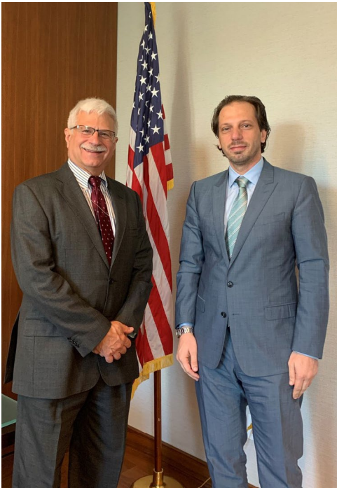
السيد مساعد وزير الخارجية للديمقراطية وحقوق الإنسان والعمل "روبرت ديسترو" – السيد فضل عبد الغني مدير الشبكة السورية لحقوق الإنسان – واشنطن/ تشرين الأول 2019

هجمات لقوات التحالف الدولي تسببت في وقوع خسائر بشرية أو مادية، والبدء في عمليات إعادة البناء هناك وتهيئة الأجواء نحو انتخابات محلية ديمقراطية يشارك فيها جميع أبناء المنطقة، وتأسيس وقيادة حوار فيما بينها، وتمّ التركيز على بعض الانتهاكات التي تقوم بها قوات سوريا الديمقراطية كعمليات الاعتقال والإخفاء القسري وغيرها مما تسبب في موجة غضب محلية واسعة، كما تمّت مناقشة فكرة ضرورة الإبقاء على موضوع المختفين قسرياً لدى جميع الأطراف قيد المتابعة والتذكير، ذلك عبر إقامة معرض من اللوحات التي رسمتها الشبكة السورية لحقوق الإنسان لنشطاء بارزين لا يزالون قيد الاختفاء القسري ويكون على هامش المعرض مؤتمر يعطي فرصة أكبر للسوريين للحديث عن قضية المعتقلين والمختفين قسرياً وبقيّة أنماط الانتهاكات.