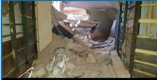
Image shows the destruction in Martyr Doctor Ziad Al Baggal Maleshri Hospital in Khan Al Sheikh town in Damascus suburbs due to government helicopters dropping barrel bombs and government artillery shells fired near the hospital in 5 & 6 October 2016

فيديو يُظهر مروحية حكومية تلقي براميل متفجرة على بلدة خان الشيخ. صور تظهر الأضرار المادية في مشفى الدكتور زياد البقاعي ومحيطها.