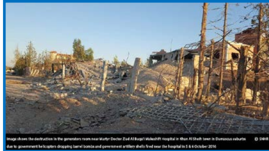
Image shows the destruction in the generators room near Martyr Doctor Ziad Al Baggal Maleshri Hospital in Khan Al Sheikh town in Damascus suburbs due to government helicopters dropping barrel bombs and government artillery shells fired near the hospital in 5 & 6 October 2016