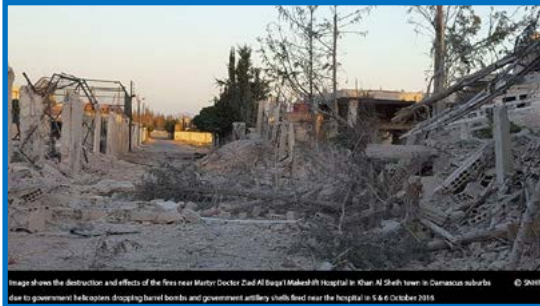
Image shows the destruction and effects of the fires near Martyr Doctor Ziad Al Baggal Maleshri Hospital in Khan Al Sheikh town in Damascus suburbs due to government helicopters dropping barrel bombs and government artillery shells fired near the hospital in 5 & 6 October 2016