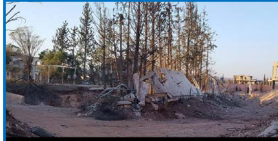
Image shows the destruction and effects of the fires near Martyr Doctor Ziad Al Baggal Maleshri Hospital in Khan Al Sheikh town in Damascus suburbs due to government helicopters dropping barrel bombs and government artillery shells fired near the hospital in 5 & 6 October 2016