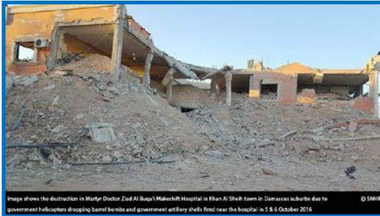
Image shows the destruction in Martyr Doctor Ziad Al Baggal Maleshri Hospital in Khan Al Sheikh town in Damascus suburbs due to government helicopters dropping barrel bombs and government artillery shells fired near the hospital in 5 & 6 October 2016