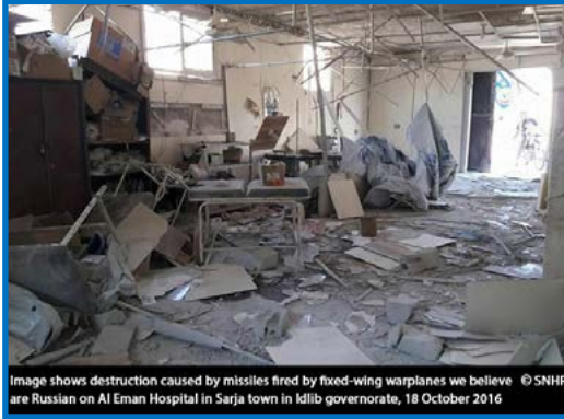
Image shows destruction caused by missiles fired by fixed-wing warplanes we believe are Russian on Al Eman Hospital in Sarja town in Idlib governorate, 18 October 2016

الثلاثاء 18/ تشرين الأول/ 2016 قصف طيران ثابت الجناح نعتقد أنه روسي صاروخاً على مشفى الإيمان، وهو المشفى الوحيد في بلدة سرجة الواقعة في جبل الزاوية بريف محافظة إدلب الجنوبي، الخاضعة لسيطرة مشتركة بين فصائل المعارضة المسلحة وجبهة فتح الشام؛ ما أدى إلى إصابة 5 أشخاص من الكادر الطبي للمشفى، إضافة إلى دمار كبير في بنائه وإصابة معداته بأضرار مادية كبيرة وخروجه عن الخدمة، الجدير بالذكر أن المشفى يخدم نحو 80 ألف شخصاً يقطنون منطقة جبل الزاوية بريف إدلب.