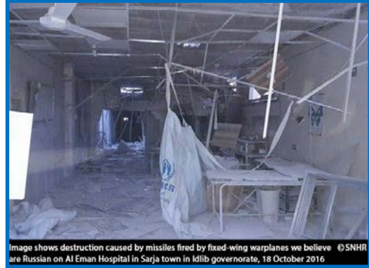
Image shows destruction caused by missiles fired by fixed-wing warplanes we believe are Russian on Al Eman Hospital in Sarja town in Idlib governorate, 18 October 2016

صباح الثلاثاء 18/ تشرين الأول/ 2016 قصف طيران ثابت الجناح نعتقد أنه روسي بالصواريخ مبنى منظومة الإسعاف الخيرية في حي مساكن هنانو بمدينة حلب، الخاضع لسيطرة فصائل المعارضة المسلحة؛ ما أدى إلى إصابة 3 مسعفين من كوادر المنظومة، إضافة إلى إصابة المبنى بأضرار مادية متوسطة.