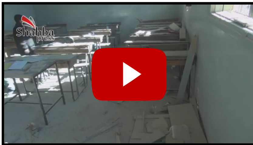
صور ثابتة توثق :

آثر الدمار في المركز الثقافي المجاور للمدرسة