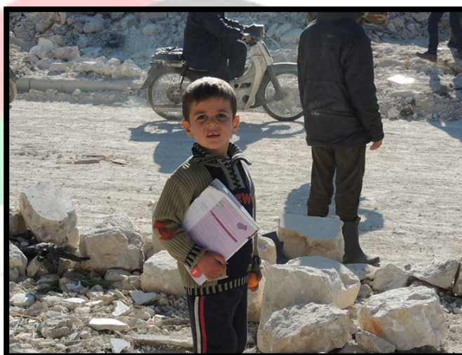
طفل يتفقد مدرسته بعد القصف الذي لصابها :