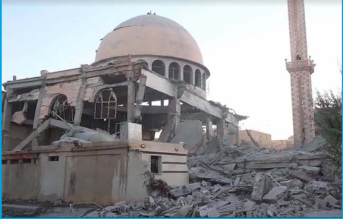
الدمار الناجم عن قصف قوات التحالف الدولي مسجد النور في حي الدرعية/ الرقة 10 / 6 / 2017

الخميس 22/ حزيران/ 2017 قصف طيران ثابت الجناح تابع لقوات التحالف الدولي بالصواريخ مسجد الزبير بن العوام في قرية كسرة فرج بريف محافظة الرقة الجنوبي؛ ما أدى إلى دمار بناء المسجد بشكل كامل وخروجه عن الخدمة، تخضع القرية لسيطرة تنظيم داعش وقت الحادثة.