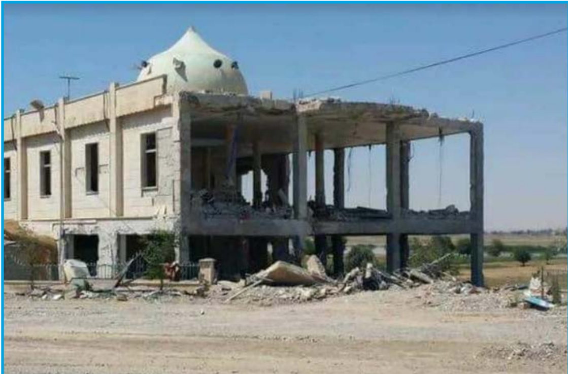
الدمار الناجم عن قصف قوات النظام السوري المسجد الكبير في قرية جديد عكيدات/ دير الزور 9/ 6/ 2017

الجمعة 9/ حزيران/ 2017 قصف طيران ثابت الجناح تابع لقوات النظام السوري بالصواريخ المسجد الغربي المعروف بالمسجد الكبير في قرية جديد عكيدات بريف محافظة دير الزور الشرقي؛ ما أدى إلى دمار كبير في بناء المسجد وخروجه عن الخدمة، تخضع القرية لسيطرة تنظيم داعش وقت الحادثة.