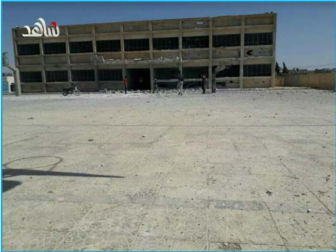
الدمار الناجم عن قصف قوات النظام السوري مدرسة تؤولي نازحين في مدينة طفس/ درعا 14 / 6 / 2017

الأربعاء 14/ حزيران/ 2017 قرابة الساعة 13:00 قصف طيران ثابت الجناح تابع لقوات النظام السوري بصاروخ مأوى للنازحين - من بلدة عثمان بريف محافظة درعا الشمالي - في مدينة طفس بريف محافظة درعا الغربي؛ ما تسبب بمجزرة، إضافة إلى دمار جزئي في بناء المأوى وإصابة مواد إكسائه بأضرار مادية متوسطة ، نُشير إلى أن المأوى عبارة عن مبنى مدرسة سابقاً -مدرسة الشهيد كيوان- تم تخصيصه لإيواء النازحين، تخضع مدينة طفس لسيطرة فصائل المعارضة المسلحة وقت الحادثة.