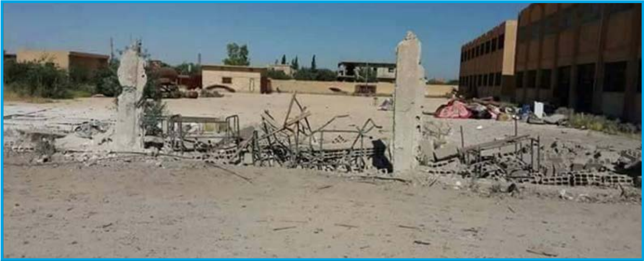
الدمار الناجم عن قصف قوات التحالف الدولي محيط إحدى المدارس في قرية السويدة الدرية / الرقة / 2 / 6 / 2017

الجمعة 2/ حزيران/ 2017 قصف طيران ثابت الجناح تابع لقوات التحالف الدولي صاروخاً قرب إحدى المدارس في قرية السويدة التابعة لناحية معدان بريف محافظة الرقة الشرقي؛ ما تسبب بخسائر بشرية، إضافة إلى دمار جزئي في سور المدرسة، تخضع القرية لسيطرة تنظيم داعش وقت الحادثة.