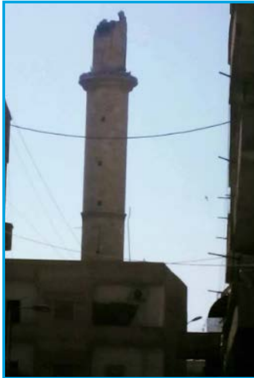
الأضرار في مئذنة المسجد الكبير الناجمة عن قصف قوات سوريا الديمقراطية المسجد في شارع المنصور/ الرقة 13/ 2017 /6

الثلاثاء 13/ حزيران/ 2017 قصفت مدفعية تابعة لقوات سوريا الديمقراطية ذات الأغلبية الكردية قذائف عدة على المسجد الكبير في شارع المنصور شرق مدينة الرقة؛ ما أدى إلى دمار جزئي في مئذنة المسجد، تخضع المنطقة لسيطرة تنظيم داعش وقت الحادثة.