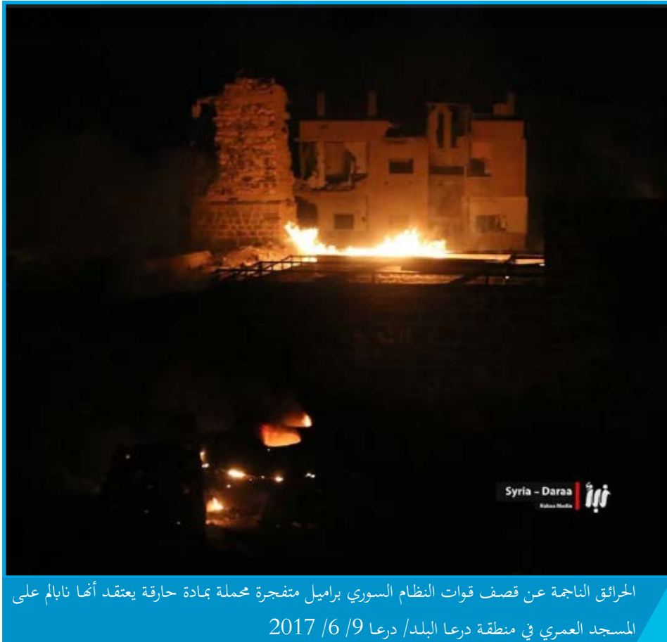
الحرائق الناجمة عن قصف قوات النظام السوري براميل متفجرة محملة بمادة حارقة يُعتقد أنها نابالم على المسجد العمري في منطقة درعا البلد/ درعا 9 / 6 / 2017

الجمعة 9 / حزيران / 2017 قرابة الساعة 00:10 ألقى الطيران المروحي التابع لقوات النظام السوري 4 براميل متفجرة محملة بمادة حارقة يُعتقد أنها نابالم على منطقة درعا البلد وسط مدينة درعا؛ سقط أحدها على المسجد العمري ؛ ما أدى إلى اندلاع حريق في الجزء الشمالي من المسجد وإصابة بنائه بأضرار مادية متوسطة، تخضع منطقة درعا البلد لسيطرة فصائل المعارضة المسلحة وقت الحادثة.