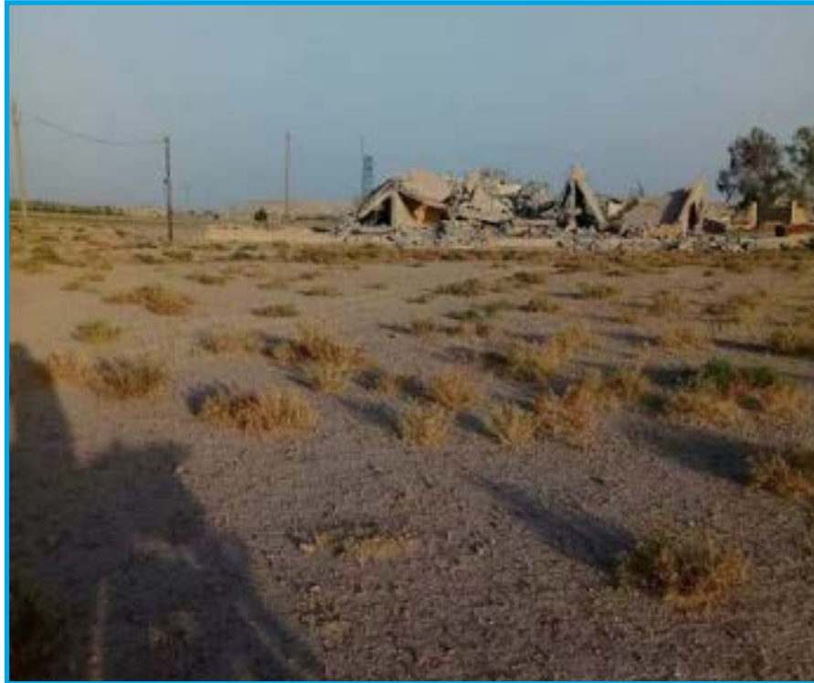
الدمار الناجم عن تفجير تنظيم داعش خزان مياه الشرب العالي في مدينة القورية/ دير الزور 23/ 6/ 2017

الجمعة 23/ حزيران/ 2017 أقدم تنظيم داعش على تفخيخ وتفجير خزان المياه العالي قرب عين علي في بادية مدينة القورية بريف محافظة دير الزور الشرقي، بواسطة عبوات ناسفة؛ ما أدى إلى دمار الخزان بشكل كامل وخروجه عن الخدمة، تخضع المنطقة لسيطرة تنظيم داعش وقت الحادثة.